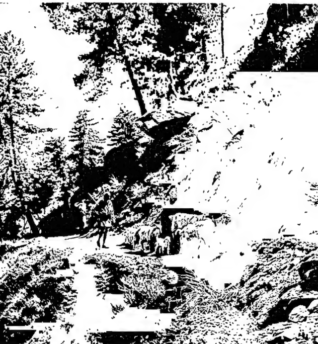
खड़ी चढ़ाई पार करता हुआ एक यायावर